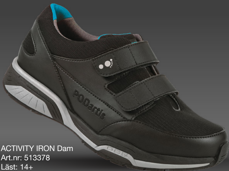
ACTIVITY IRON Dam Art.nr: 513378 Läst: 14+ Stl: 36-39

Rekommenderas för reumatiker, diabetiker och postkirurgiska ömma fötter.