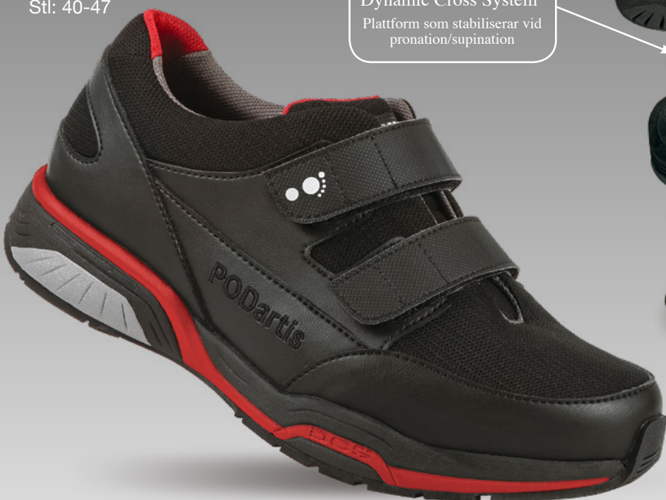
ACTIVITY IRON Herr Art.nr: 513278 Läst: 14+ Stl: 40-47

DCS Dynamic Cross System® Plattform som stabiliserar vid pronation/supination